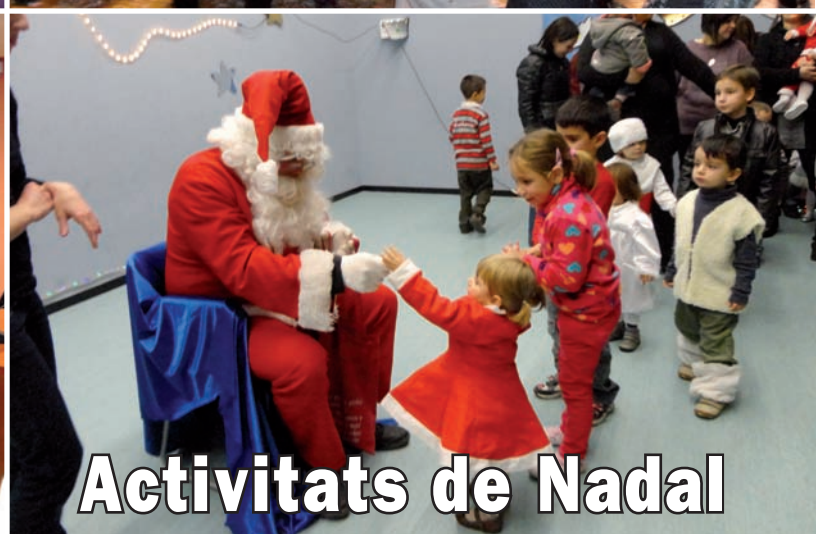
Activitats de Nadal