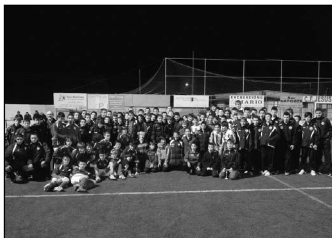
Foto de grup amb tots els equips participants a la 2a edició Terra Rubra