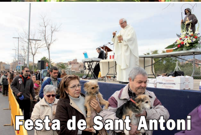
Festa de Sant Antoni