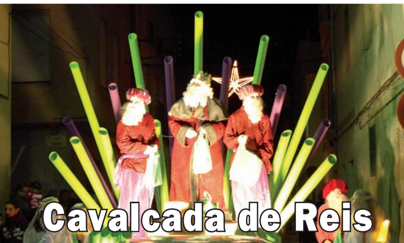
Cavalcada de Reis