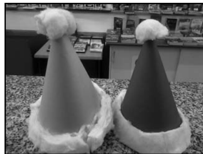
Manualitats de Nadal