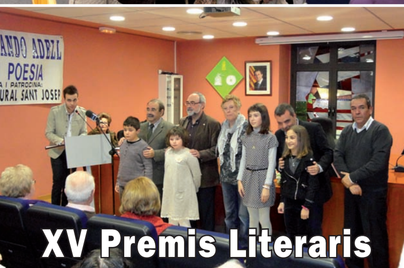
XV Premis Literaris