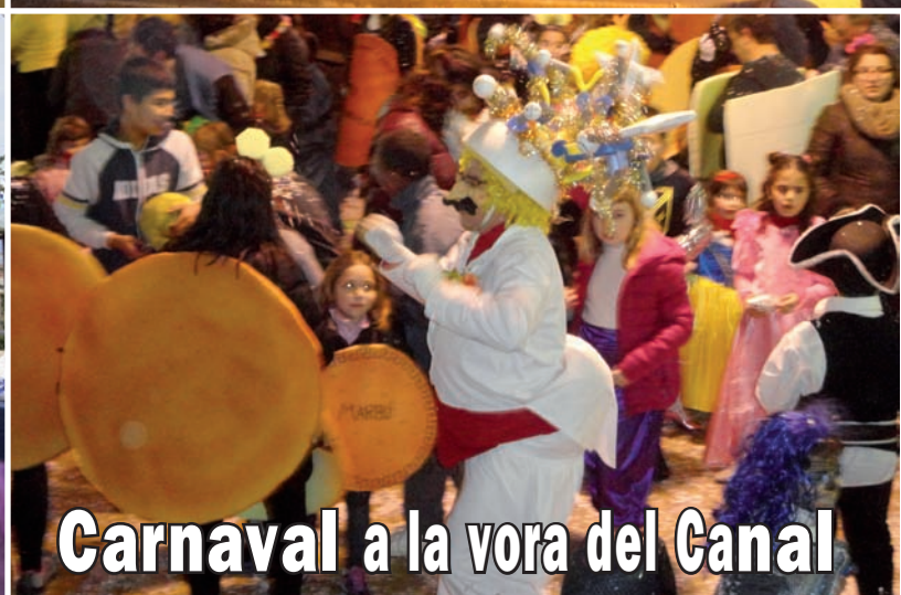
Carnaval a la vora del Canal