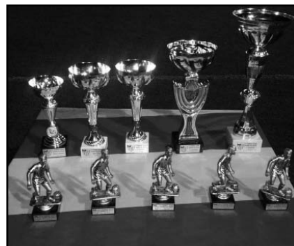
Trofeus als equips participants, 3r classificat, 2n classificat, 1r classificat, màxim golejadore i millor porter