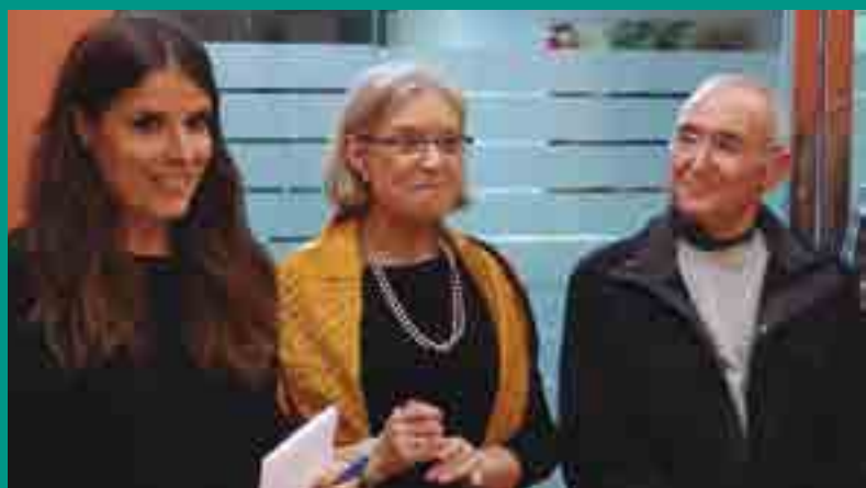
EXPOSICIÓ ROSER PANISELLO