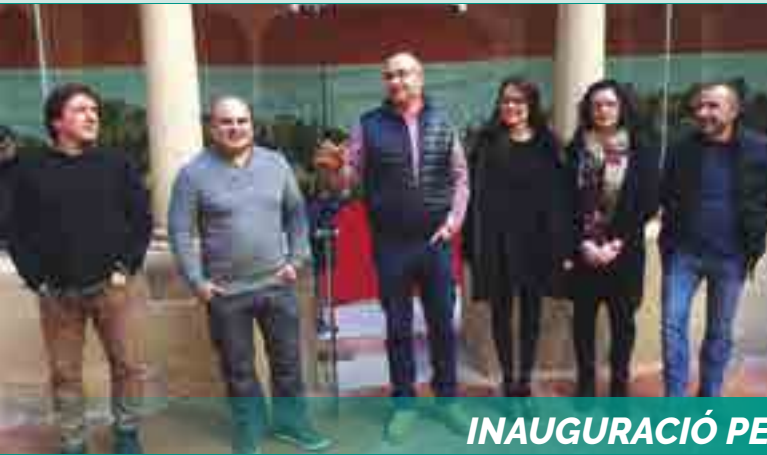
INAUGURACIÓ PESSEBRE ARTESANAL