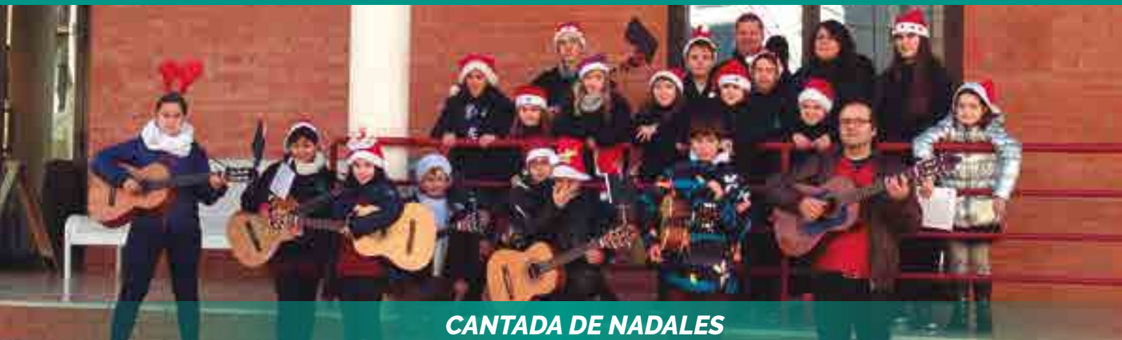
CANTADA DE NADALES