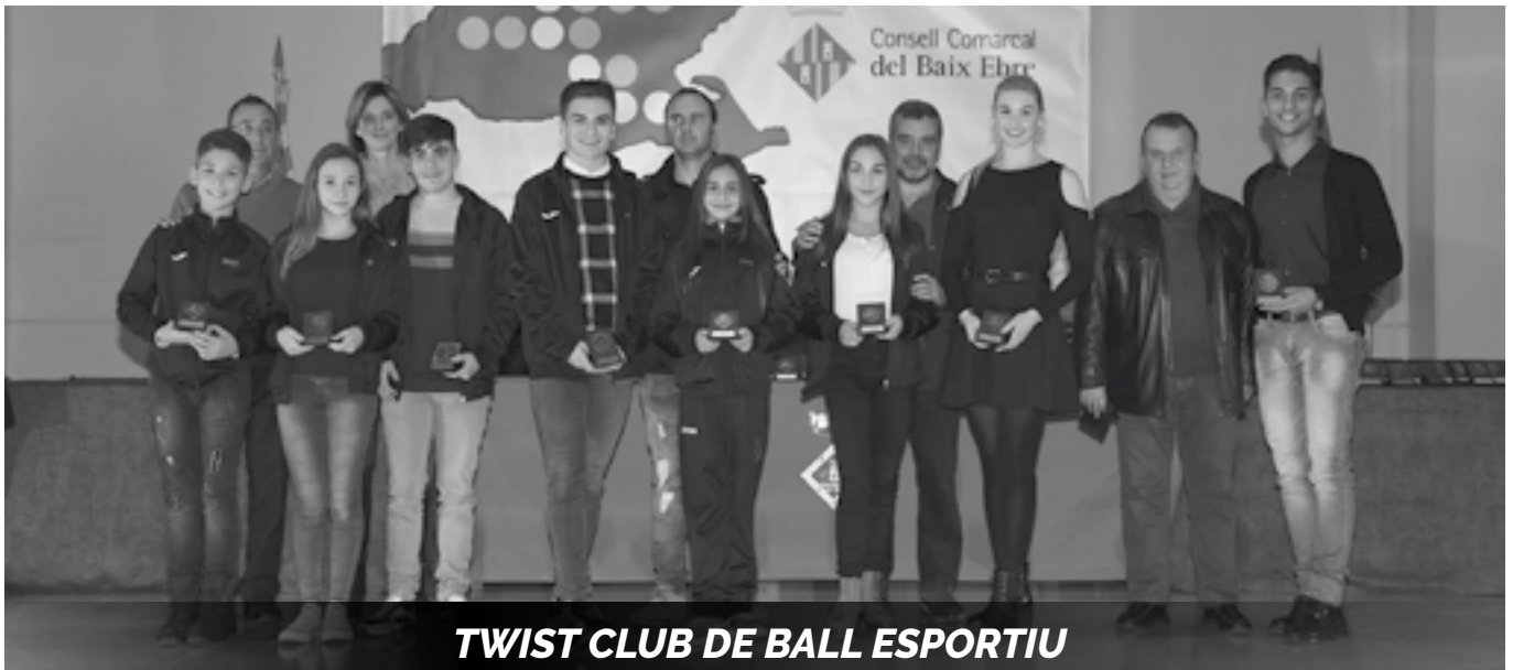
TWIST CLUB DE BALL ESPORTIU