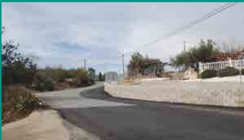
AMPLIACIÓ CAMÍ TERRER ROIG