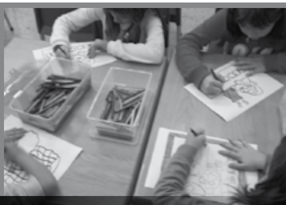
DECOREM LA BIBLIO PER NADAL