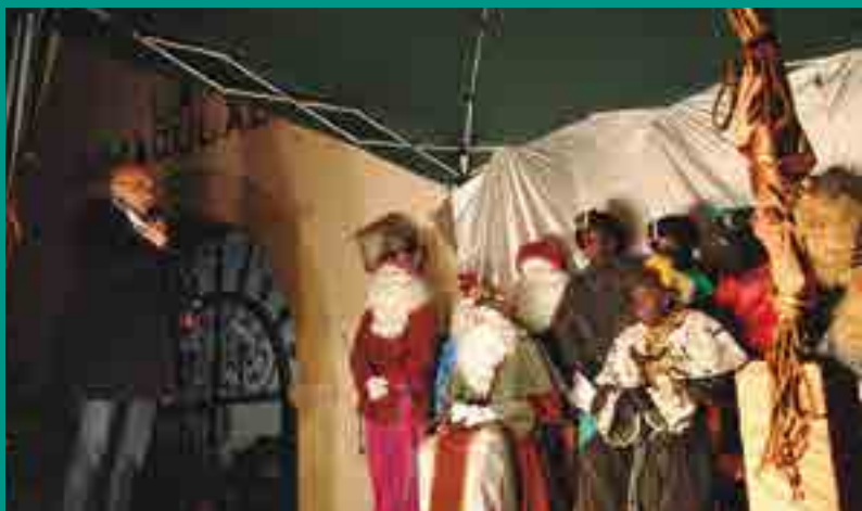
NIT DE REIS