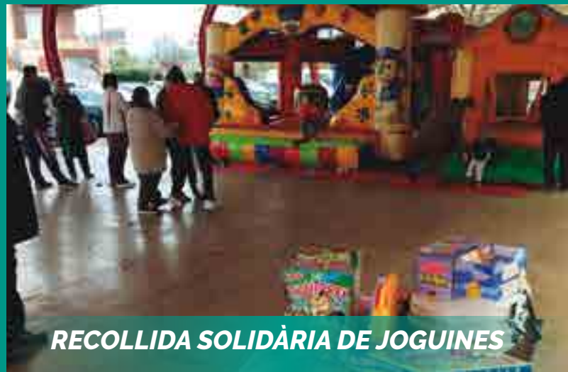
RECOLLIDA SOLIDÀRIA DE JOGUINES