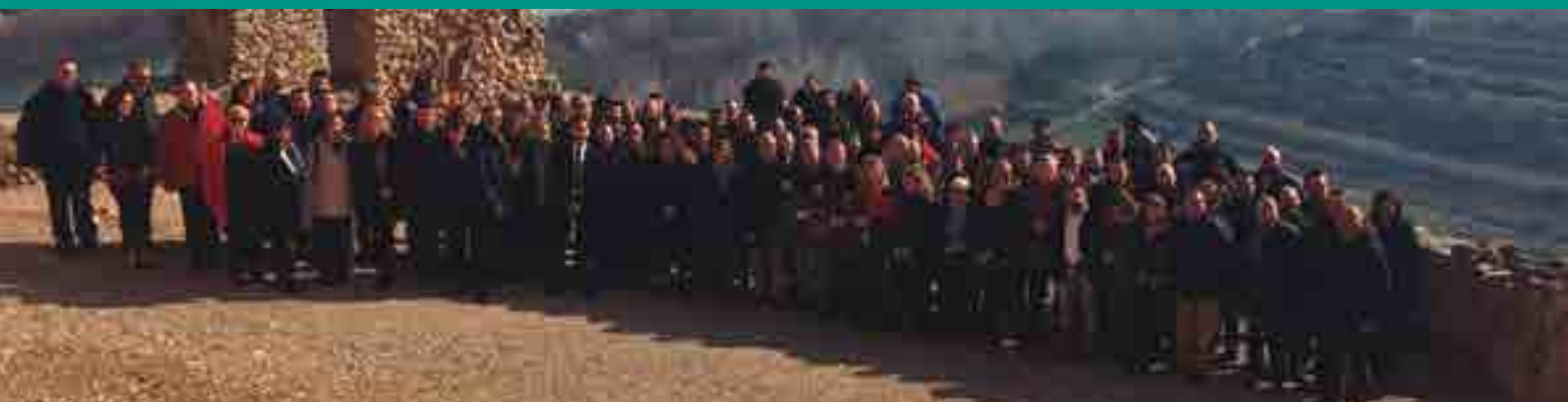
PRESENTACIÓ AECAT A MIRAVET

XXII Fira de l'oli de les Terres de l'Ebre i I Fira de la Garrofa