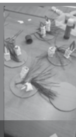
FEM CANDELES DE PAPER