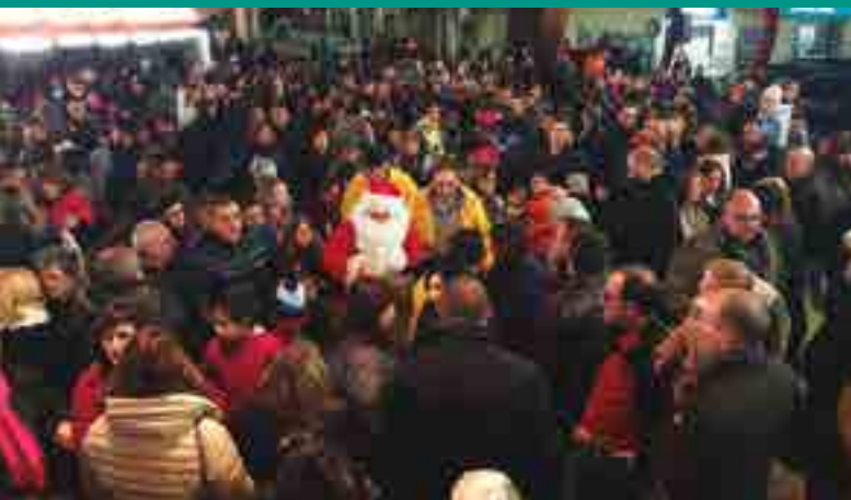
ARRIBADA PARE NOEL