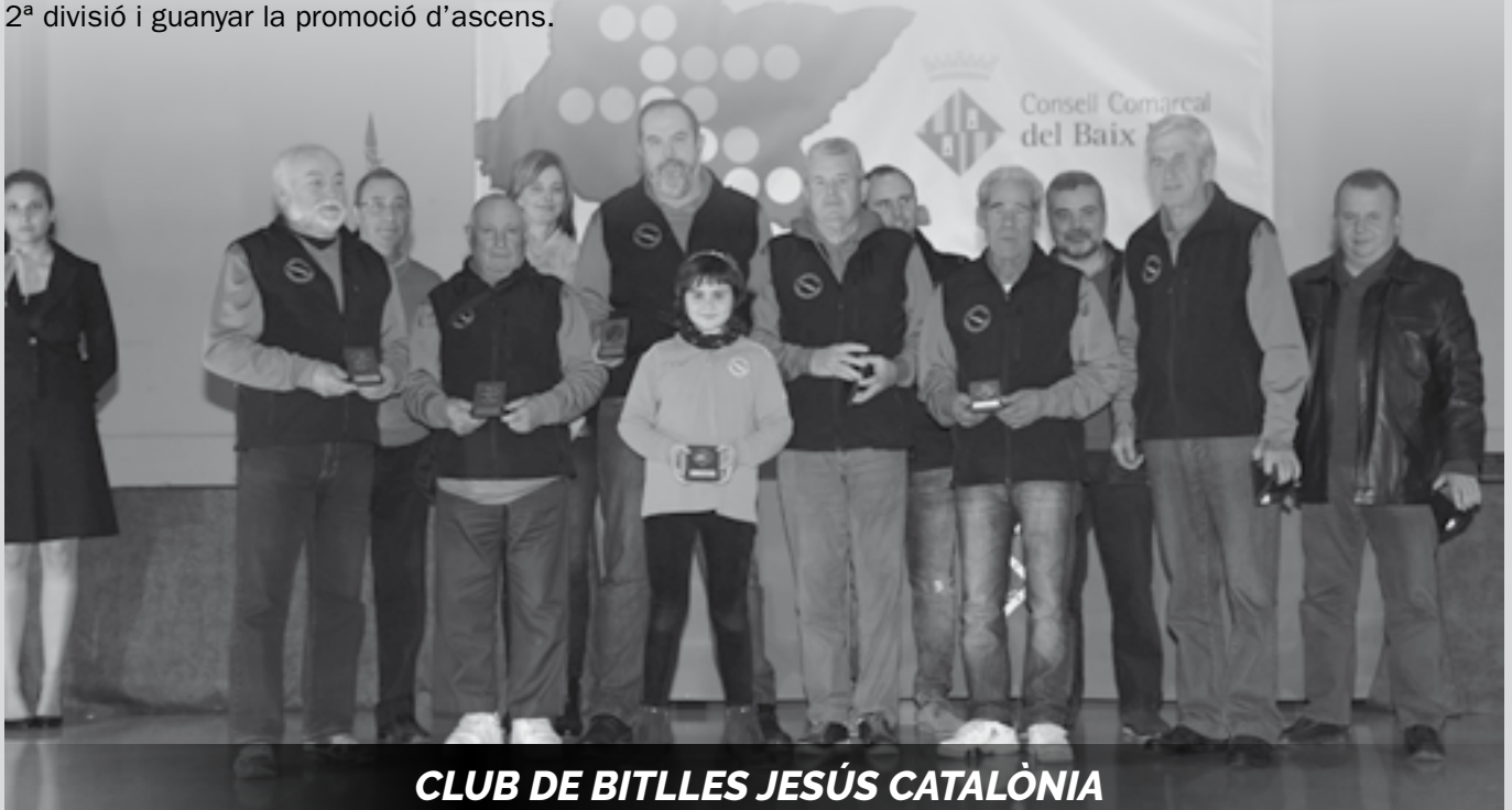
CLUB DE BITLLES JESÚS CATALÒNIA

L'equip Catalònia Dermisa va pujar a 1 a divisió de la Lliga Territorial de Birles, després de quedar 2n classificat a 2 a divisió i guanyar la promoció d'ascens.