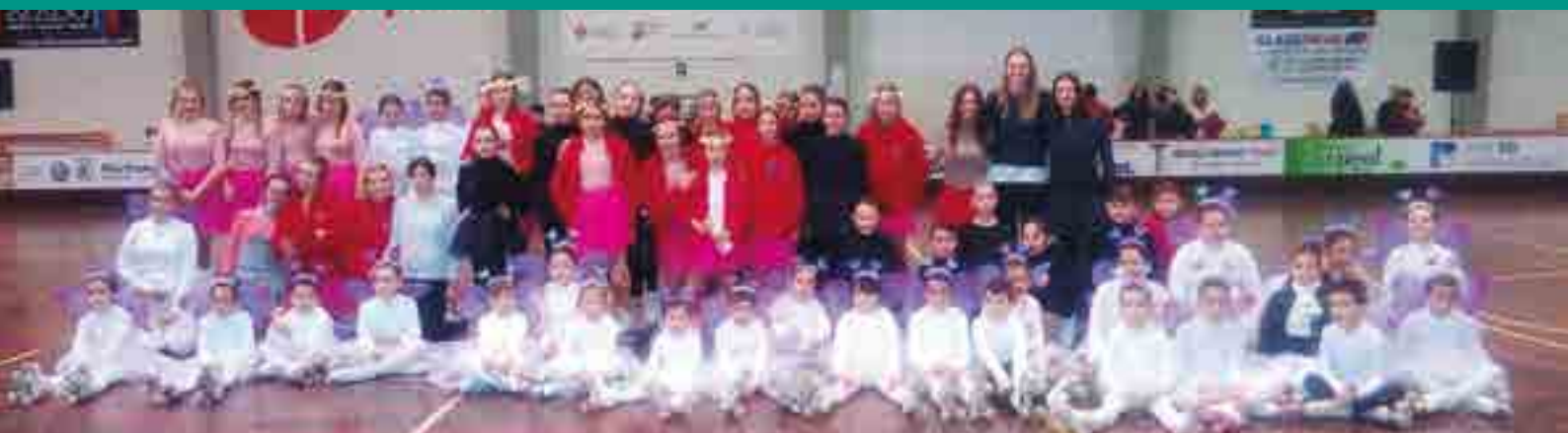
FESTIVAL DE NADAL CLUB PATÍ JESÚS