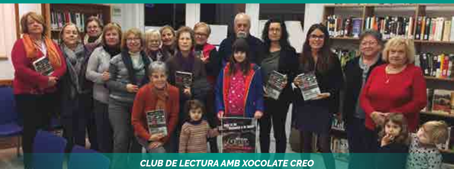
CLUB DE LECTURA AMB XOCOLATE CREO