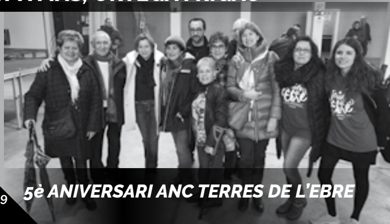
5è ANIVERSARI ANC TERRES DE L'EBRE