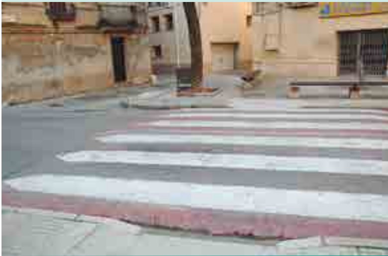
SUPRESSIÓ DE LES BARRERES ARQUITECTÒNIQUES