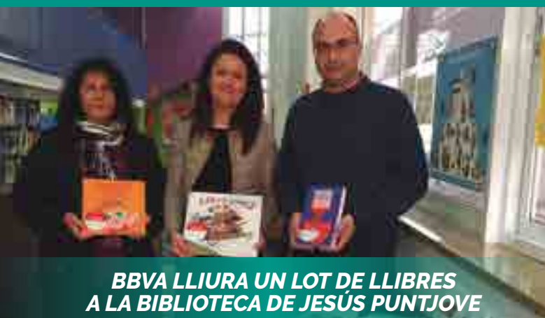
BBVA LLIURA UN LOT DE LLIBRES A LA BIBLIOTECA DE JESÚS PUNTJOVE