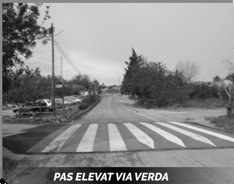
PAS ELEVAT VIA VERDA