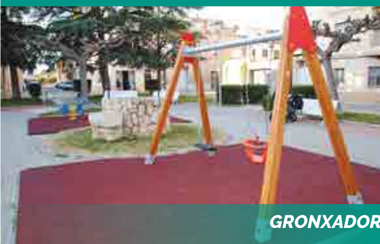
GRONXADORS PLAÇA BOUS