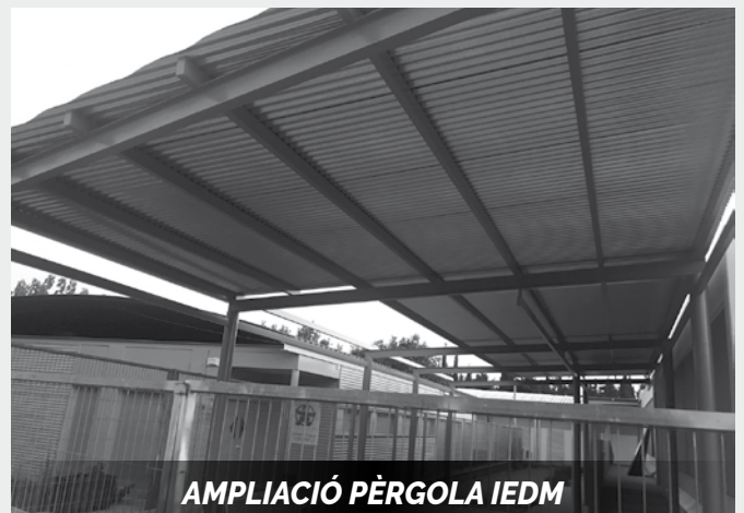
AMPLIACIÓ PÈRGOLA IEDM