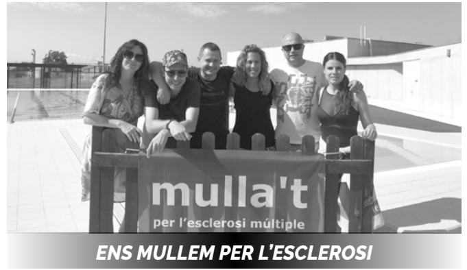
ENS MULLEM PER L'ESCLEROSI