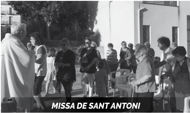
MISSA DE SANT ANTONI