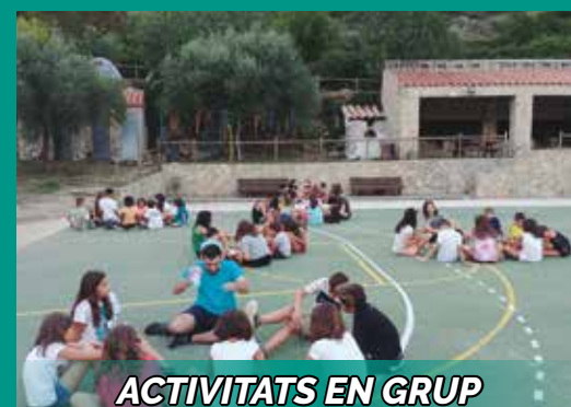
ACTIVITATS EN GRUP