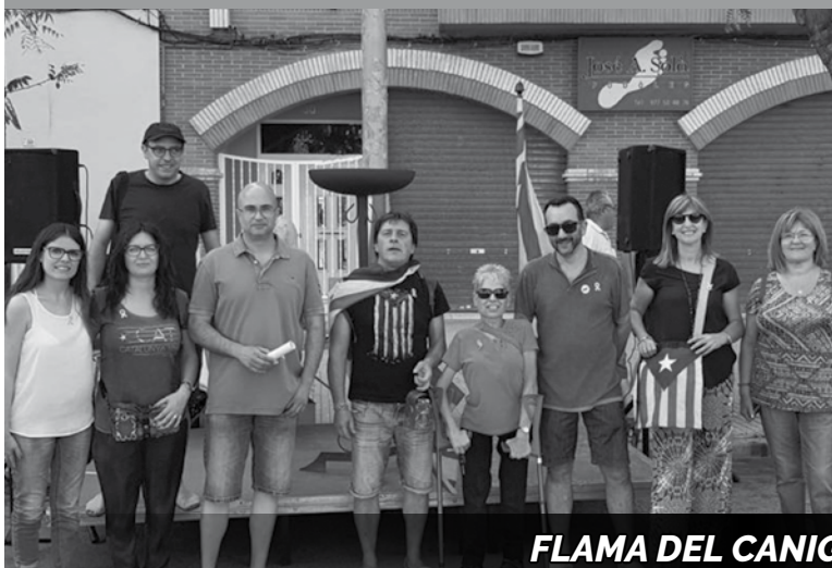
FLAMA DEL CANIGÓ 2018