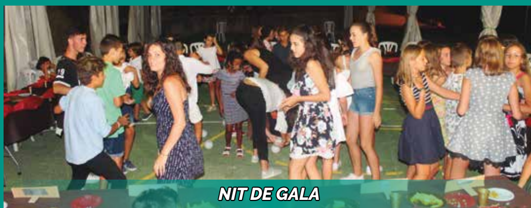
NIT DE GALA