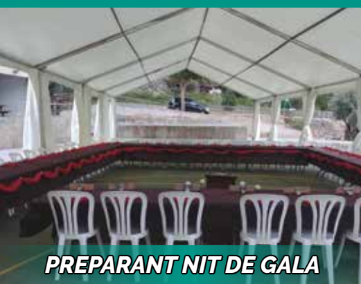
PREPARANT NIT DE GALA