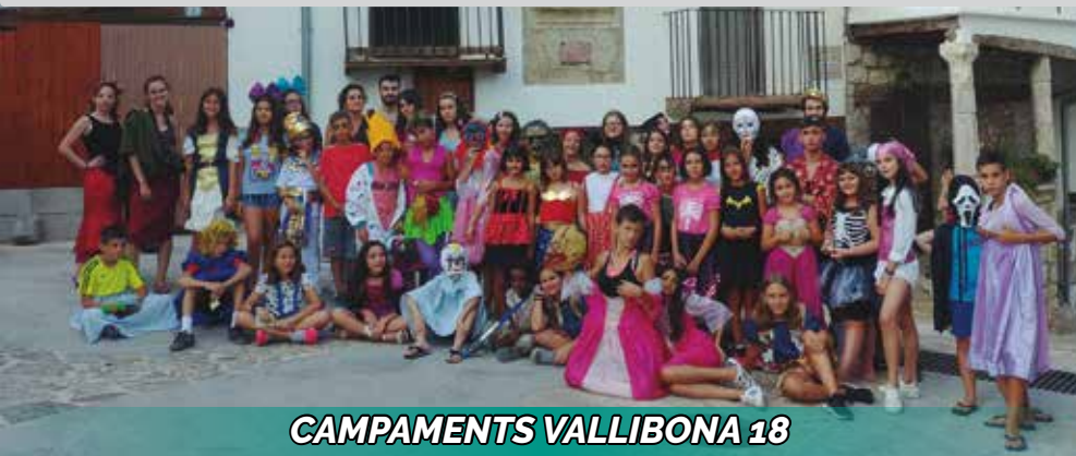
CAMPAMENTS VALLIBONA 18