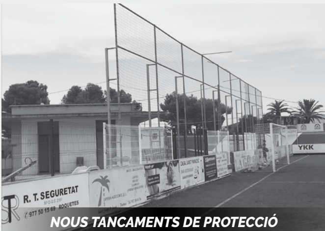
NOUS TANCAMENTS DE PROTECCIÓ