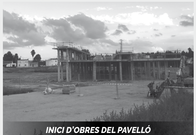
INICI D'OBRES DEL PAVELLÓ