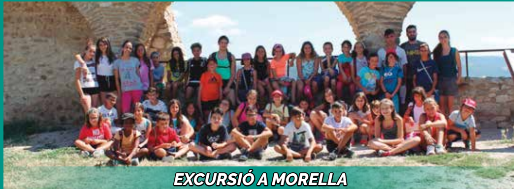
EXCURSIÓ A MORELLA