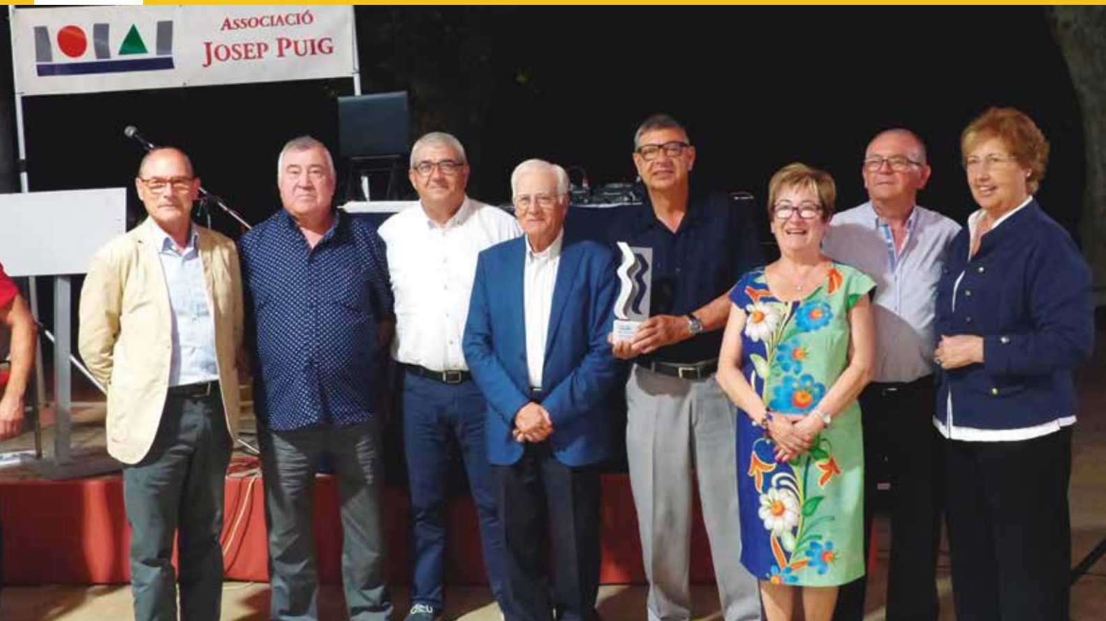
CASAL DE JUBILATS SANT FRANCESC ESCOLLIT JESUSENC DE L'ANY 2017

informatiu JESUSENC SETEMBRE | OCTUBRE 2018