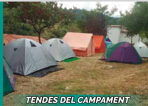
TENDES DEL CAMPAMENT