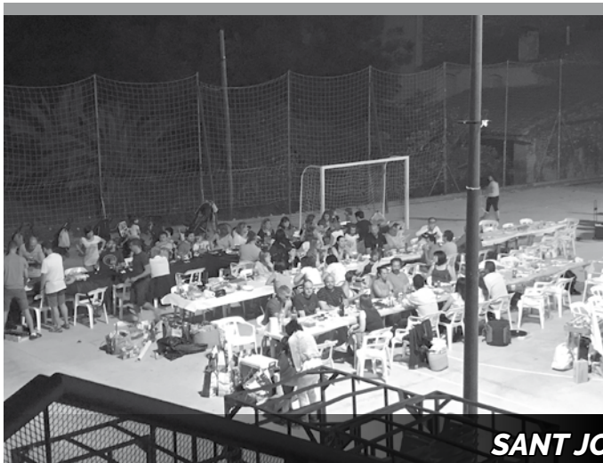
SANT JOAN 2018