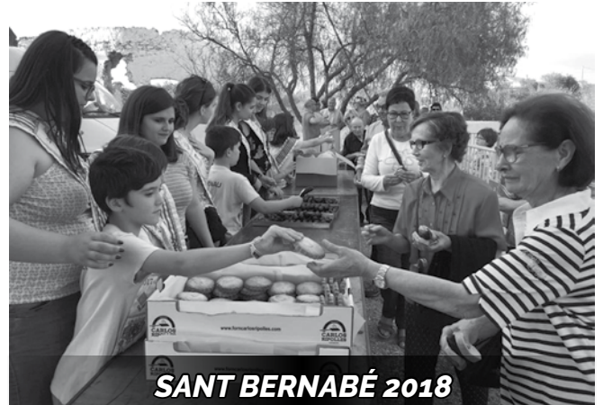
SANT BERNABÉ 2018

L'Organització d'aquests actes va ser a càrrec de l'EMD de Jesús, la Secció de Festes i les entitats del poble.