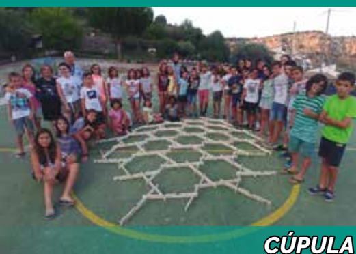
CÚPULA DA VINCI