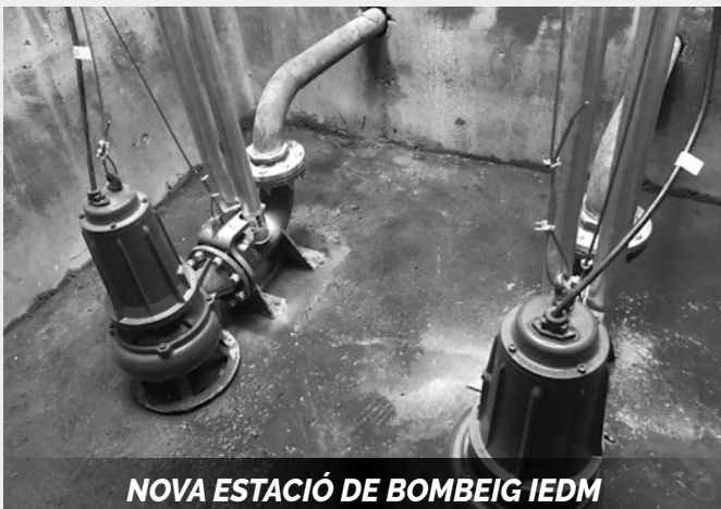
NOVA ESTACIÓ DE BOMBEIG IEDM