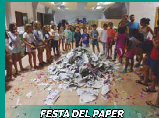
FESTA DEL PAPER