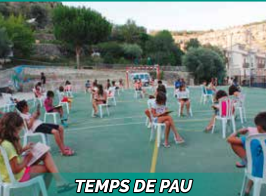
TEMPS DE PAU